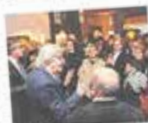
Sgarbi a Bergamo ripropone

«Credo nel diritto alla creatività alla possibilità di esporsi e che qualcuno lo consideri. Ma per essere artisti serve dell'altro, cioè parlare qualcosa che sia di bene comune». Così il critico d'arte Vittorio Sgarbi intervenendo a Bergamosi al vernissage presso InArte Werkkunst Gallery. In esposizione, fino al 19 gennaio, la rassegna «Nowart», che propone una raccolta